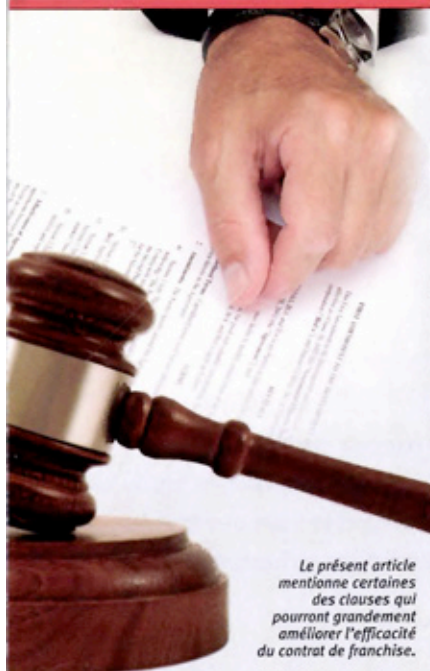
Le présent article mentionne certaines des clauses qui pourront grandement améliorer l'efficacité du contrat de franchise.