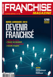
Numéro 12 (2010)

http://www.franchise-magazine.com/opinions/franchiseurs-modernisez-vos-clauses-d-exclusivite-128.html