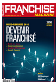
Numéro 12 (2010)

http://www.franchise-magazine.com/opinions/franchiseurs-modernisez-vos-clauses-d-exclusivite-128.html