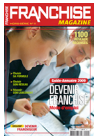
Numéro 11 (2009)