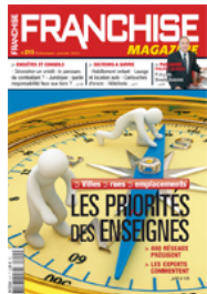
Décembre-Janvier 2010 Numéro 215

http://www.franchise-magazine.com/opinions/reglement-europeen-de-la-franchise-un-savoir-faire-mieux-reconnu-120.html